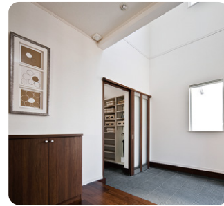
シューズクローゼットは、靴だけでなく、ベビーカーや、アウトドア用品、濡れたものを一時置きできるようなスペースがあると、常に玄関を美しく保てます。