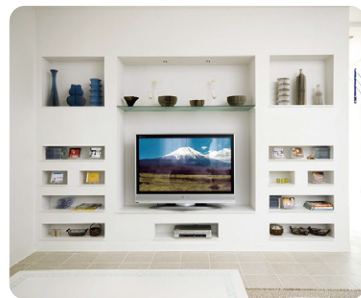
テレビ周りで雑然とするオーディオ類や小物も、それぞれの棚を「定位置」にすれば、きれいに収まります。