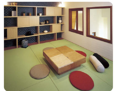
見せる棚と、隠せる扉付き収納を組み合わせた造作家具もお洒落です。