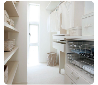
収納と作業スペースを兼ねた洗濯室をつくと、「洗う・干す・たたむ・しまう」の家事効率も上がります。