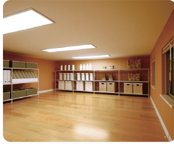
1階と2階の間に、「収's(しゅうず)」をつくることによって、シーズンオフの電化製品や、思い出の品などもたっぷりしまえます。