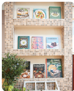
壁埋め込み式のマガジンラックには、レシボ本や新聞、お子様の絵本もさり気なくお洒落に収まります。