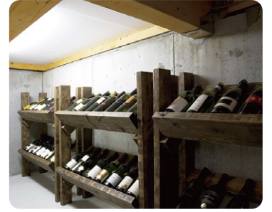
温度変化が少ない半地下スペースを活用して、ワインセラーも作れます。