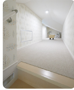
固定階段でのぼれる小屋裏収納やロフトは、大きな荷物も運びやすく安全です。