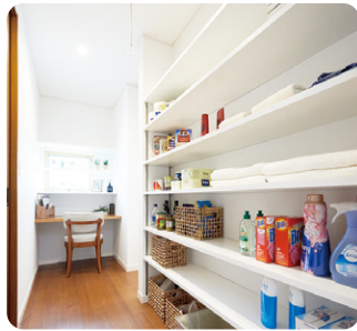
パントリーは、機能的な可動棚にしたり、キッチンと洗濯スペースの中央に配置する等の動線を考慮した工夫が、使い勝手を良くします。