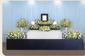
※祭壇写真はイメージです

安易に「家族葬」という言葉にとらわれるのではなく、一般的なお別れをしていただくべき方への配慮もどうぞお気軽にお申し付けください。